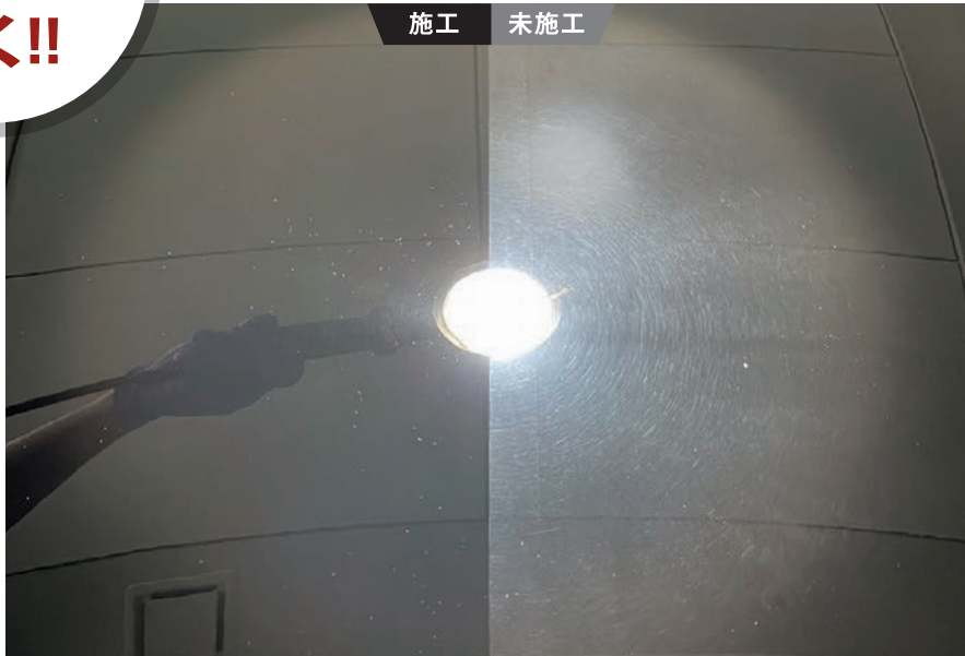
ボンネットへ擬似的にキズをつけて、CPCボディコーティングReMakeを施工した状態です。